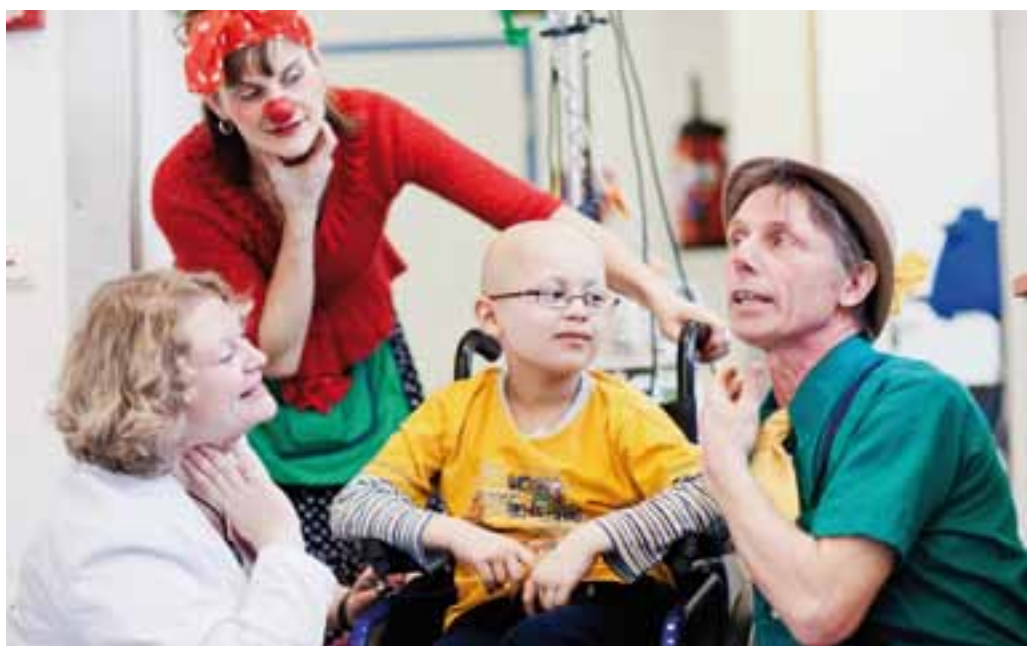
Klinik-Clowns bei der Arbeit